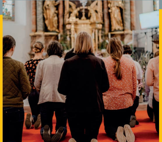
U.T.U.R.N | Lobpreiswochenende