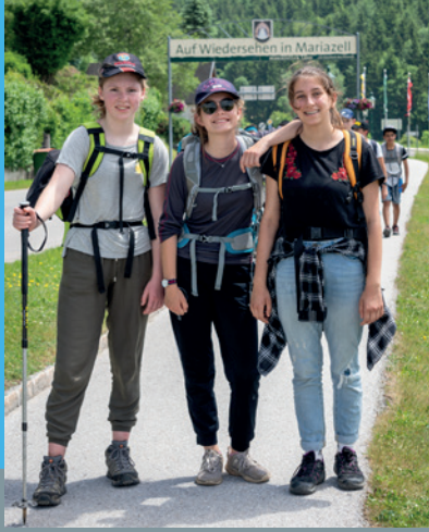
Fußwallfahrt nach Mariazell