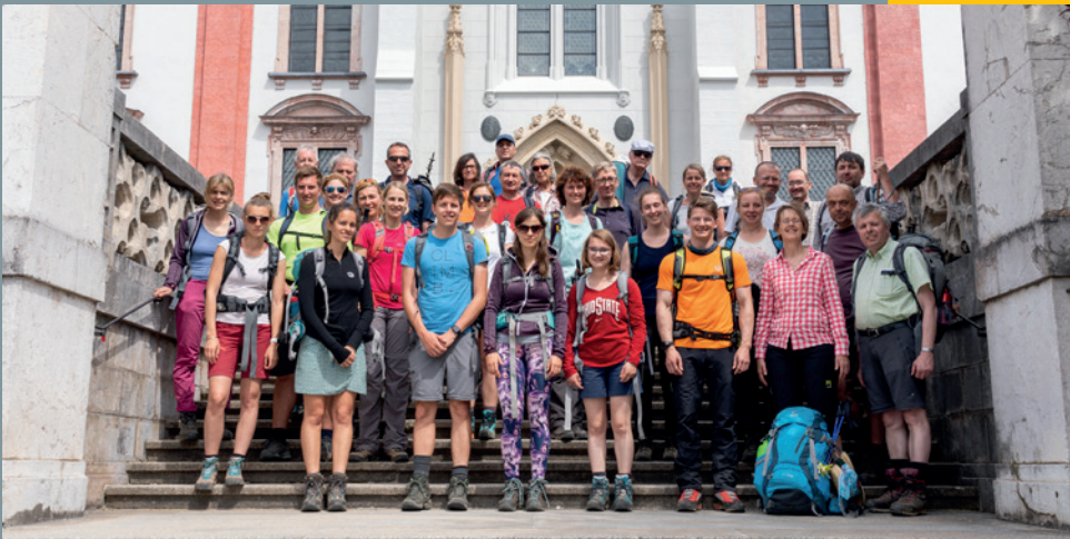
Fußwallfahrt nach Mariazell